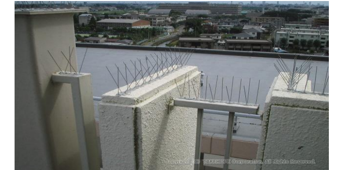
バードフライトスパイク取付写真 ②