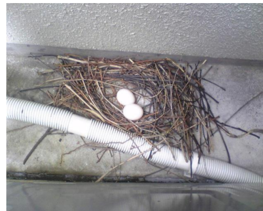
(エアコン室外機の裏に鳩の巣)