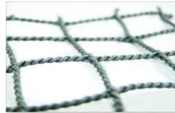
当社オリジナルネット取付写真 ①