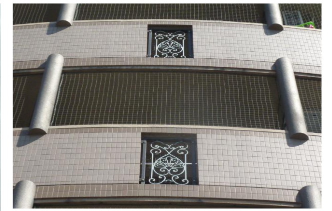
当社オリジナルネット取付写真 ②