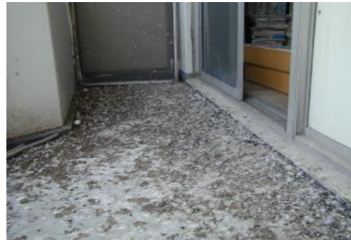
(マンション・バルコニー鳩糞被害写真：①)