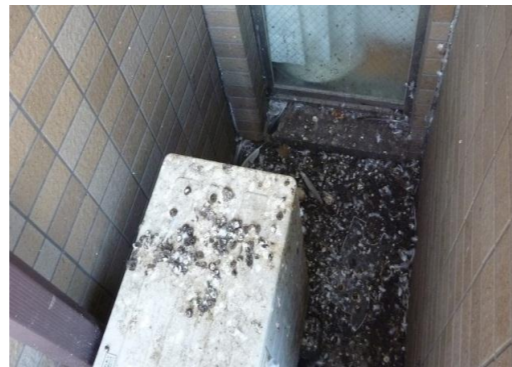
(マンション・バルコニー鳩糞被害写真：②)