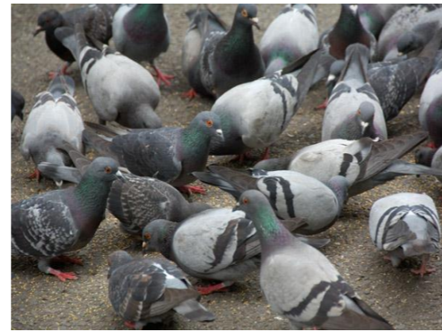
(ドバト集団の写真)