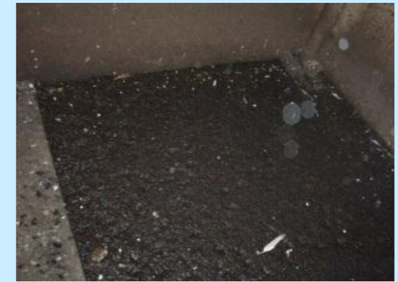
1階部分に溜まった鳩の糞