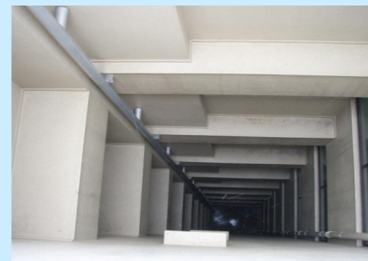
洗浄後 吹き抜け内部