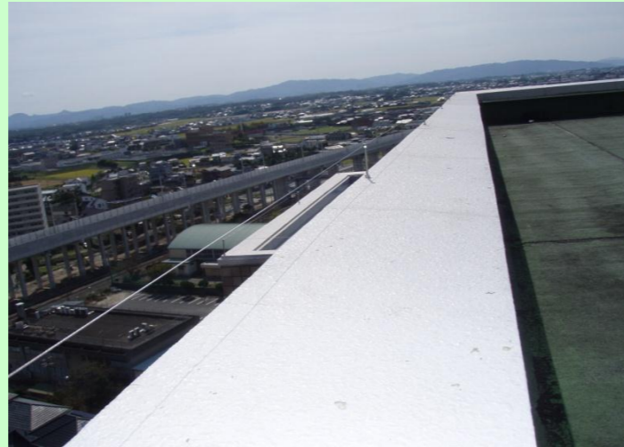
マンション 屋上 パラペット部