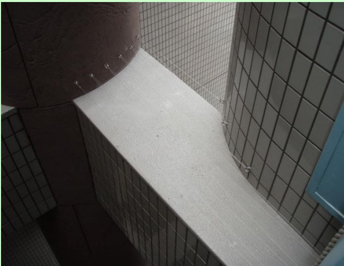
マンション 吹抜け 梁上部