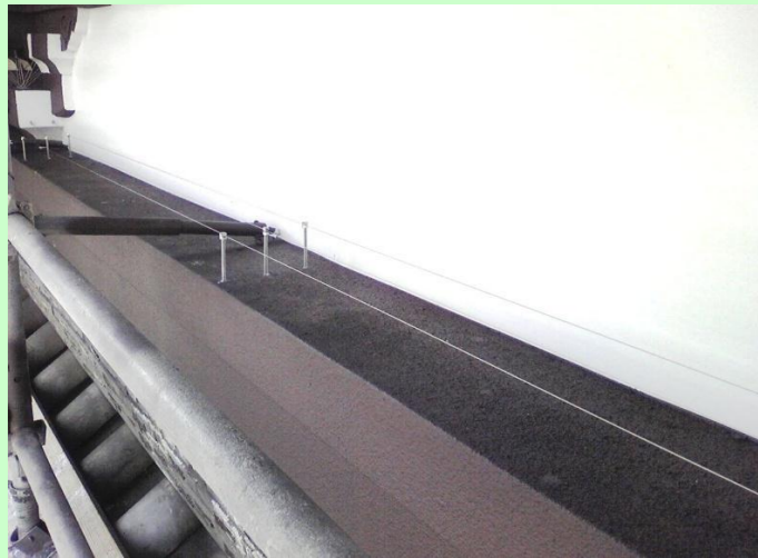
某御寺 天面 梁上部