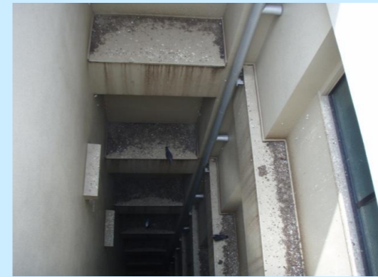
吹抜け部 屋上からの写真