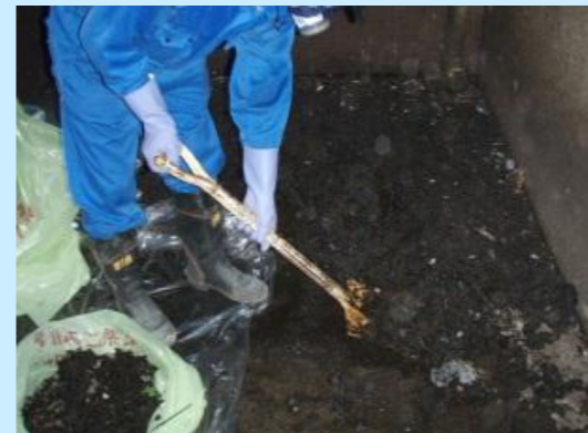
積った鳩の糞の撤去中