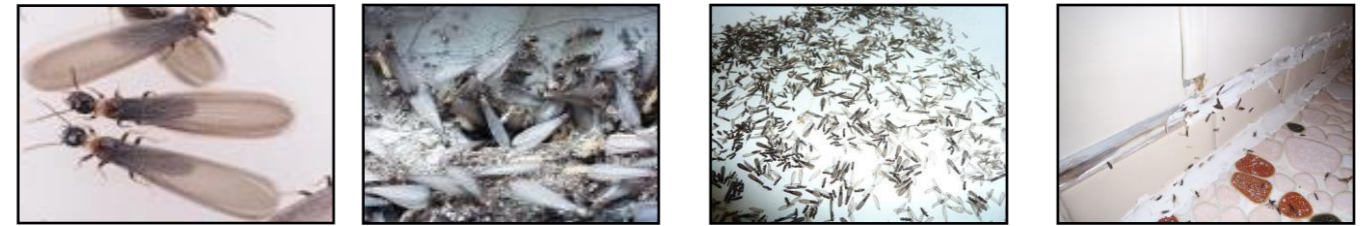
浴槽に浮かぶ大量の羽蟻