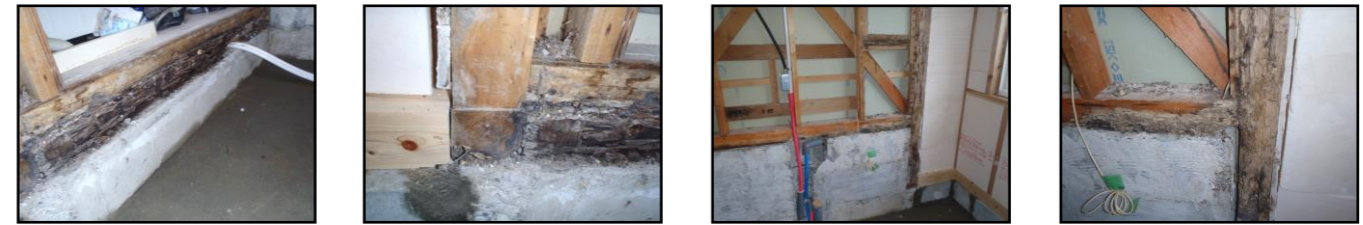
腐朽&食害でボロボロの土台(左 遠景 右 近景)

ヤマトシロアリの羽蟻の群飛シーズンが到来しました。4月下旬～5月の日中...特に雨後の温暖な日の午前10時～12時頃に群飛します。写真は浴室に大量発生したヤマトシロアリの羽蟻の写真です。浴室周りの土台を食害し、浴室を中心に被害が広がっていました。